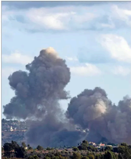
LOS BOMBARDEOS israelíes se concentraron en el sur de Líbano.

El Ejército israelí informó ayer que bombardeó diferentes "objetivos" de la milicia chií Hezbollah en el sur y sureste del Líbano, mientras en el país aumenta la incertidumbre sobre si esto será o no el preludio de una guerra abierta en esta región. En un comunicado, el Ejército israelí dijo estar "atacando objetivos de Hezbollah en el Líbano para dañar y destruir" capacidades e infraestructura de la milicia proiraní, y calificó estas actividades como requisito para cumplir con los objetivos de la guerra en Gaza. El objetivo es "llevar seguridad al norte de Israel con el fin de permitir el regreso de los residentes a sus hogares", concluye el texto, en referencia a los cerca de 60.000 israelíes que siguen evacuados de las comunidades fronterizas desde que comenzó el fuego cruzado con Hezbollah, paralelo a la guerra en Gaza. Según informó el canal local de televisión Al Manar, perteneciente a Hezbollah, en concreto, cazas israelíes lanzaron más de medio centenar de bombardeos contra varias zonas. "El número de bombardeos aéreos realizados por el enemigo aumenta a 52 contra las zonas de Al Hargiya en Al Mahmudeya, el extrarradio de Al Aishiyá, los Altos de Rihan y los alrededores de