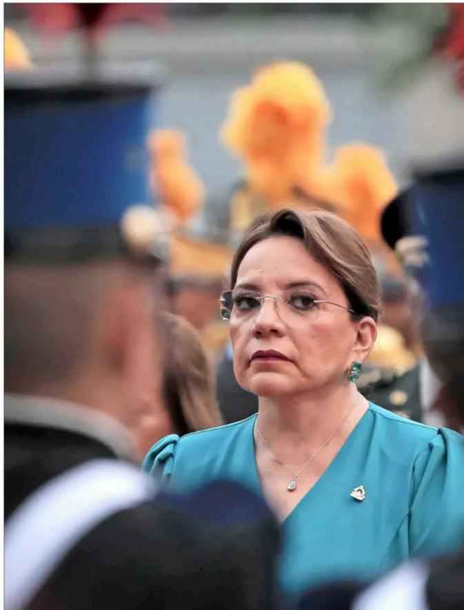
CASTRO, en el poder desde 2022, denunció que es víctima de un supuesto complot.

“La embajadora nada más dio su opinión, se podría solucionar con una nota diplomática o una audiencia, pero de inmediato el gobierno de Castro se enfocó en anular el tratado de extradición, acusando que era una ‘injerencia’”. Son puros pretextos, excusas. Está tratando de proteger a familiares”, comentó a “El Mercurio” Mike Vigil, jefe de operaciones de la agencia antidrogas de Estados Unidos (DEA), quien