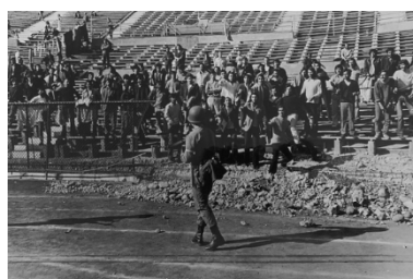
Presos políticos, hombres y mujeres, detenidos en el Estadio Nacional de