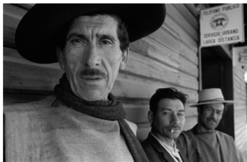
©Raymond Depardon (Magnum Photos) 1971 - Campesinos chilenos en la ciudad natal del poeta Pablo Neruda, Premio Nobel de Literatura en 1971. Parral, provincia de Linares, 21 de septiembre de 1971.