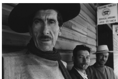
Campesinos chilenos en la ciudad natal del poeta ganador del Premio Nobel Pablo Neruda. en 1971. Parral, provincia de Linares, 21 de septiembre de 1971.