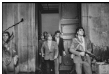
Léopold Victor Vargas, último retrato de S. Allende vivo, 11.09.73